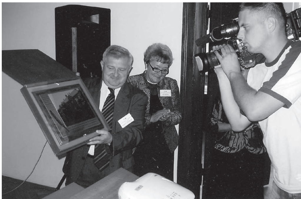
Rok 2006. Uroczystość z okazji stulecia budynku szkoły..