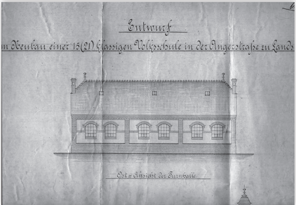
Projekt szkoły i sali gimnastycznej z 1906 roku.