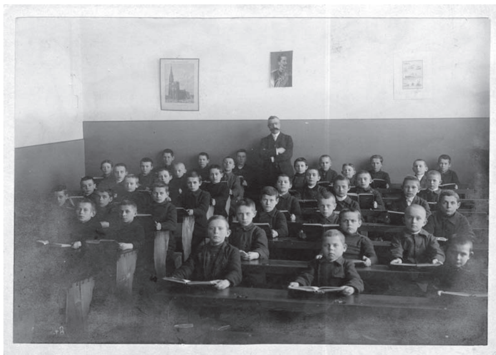
Lekcja w niemieckim gimnazjum.

O ile instytucje oświaty po stronie Starego Miasta rozwijały się nieprzerwanie, to związki Zawarcia ze szkolnictwem uległy zerwaniu na dłuższy czas. Początkowo miejsce szkoły miejskiej znalazło się pośród najznamienszych budowli Landsberga: na Rynku pomiędzy kościołem Mariackim a ratuszem. Nie znamy jej wyglądu, ani relacji w stosunku do obiektów, jakie towarzyszyły farze, cmentarzowi i do stojącego tu prawdopodobnie kościoła św. Jana. Jednak